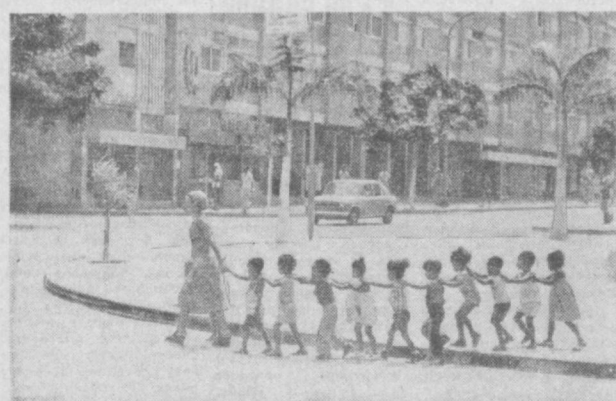
Правительство Народной Республики Ангола проявляет большую заботу о подрастающем поколении.

В июне генподрядчик предстоит освоить на строительстве 119 тысяч рублей.