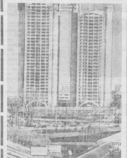
Новому Белграду — одному из самых молодых районов югославской столицы — исполнилось 30 лет. За эти годы здесь возведены дома с 50 тысячами квартир, десятки школ, детских садов, магазинов, предприятий бытового обслуживания. Молодой район символизирует дружбу и братство народов Югославии. Его строили и в нем живут представители всех югославских республик.