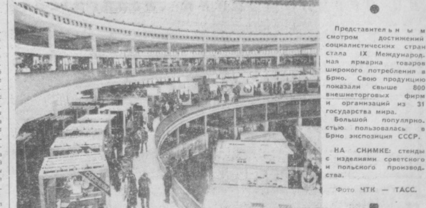
НА СНИМКЕ: стелды с изданием светского и польского производства.