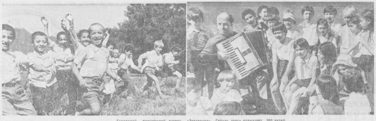
Городской пионерский лагерь «Звездочка». Сейчас здесь отдыхают 360 детей. НА СНИМКАХ: на думайке; пионеры из отряда «Ромашка» разучивают новую отрядную песню.