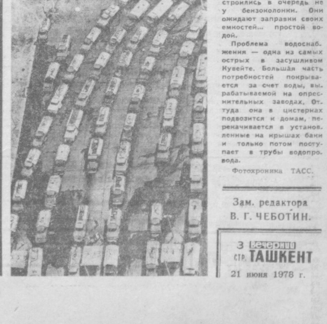
Эти автоцистерны выстроились в очередь на у бензоколонки. Они ожидают заправки своих емкостей... водой.

Из разных стран приезжают в музей исследователи творчества Толстого, чтобы поработать в уникальном архиве и библиотеке, где собраны все издания произведений писателя, когда-либо выходившие в России и за ее пределами. Особенно поражают иностранцев тиражи книг Толстого. Действительно, они огромны. Произведения великого писателя издавались в СССР 2455 раз тиражом 200 млн. экземпляров на 98 языках народов СССР и зарубежных стран. Только в нынешнем, юбилейном году издательства страны выпустят свыше 40 млн. экземпляров произведений Толстого. Начнет выходить новое