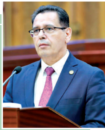
Кўнғиротбой ШАРИПОВ, олий таълим, фан ва инновациялар вазири

Юртимизнинг кўхна ва ҳамisha навқирон шахри — Самарқанд яна бир тарихий анжуманга мезбонлик қилди. Минг йиллар давомида илм-фан, санъат, фалсафа ва савдо маркази бўлиб келган мазкур шаҳарда ўтган “Марказий Осиё — Европа Иттифоқи” биринчи саммити чинакам тарихий аҳамиятга эга.