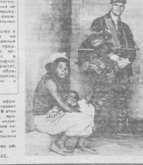
НА СНИМКЕ: французский наратель в доме африканца в пригороде Колвази.