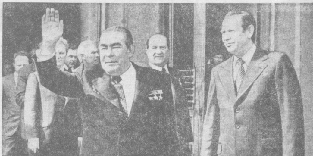
МИНСК, 25 июня. Встреча на вокзале.

№ 143 (3644) ПОНЕДЕЛЬНИК, 26 ИЮНЯ 1978 Г. Издаётся с 1 июля 1966 г. Цена 2 коп.