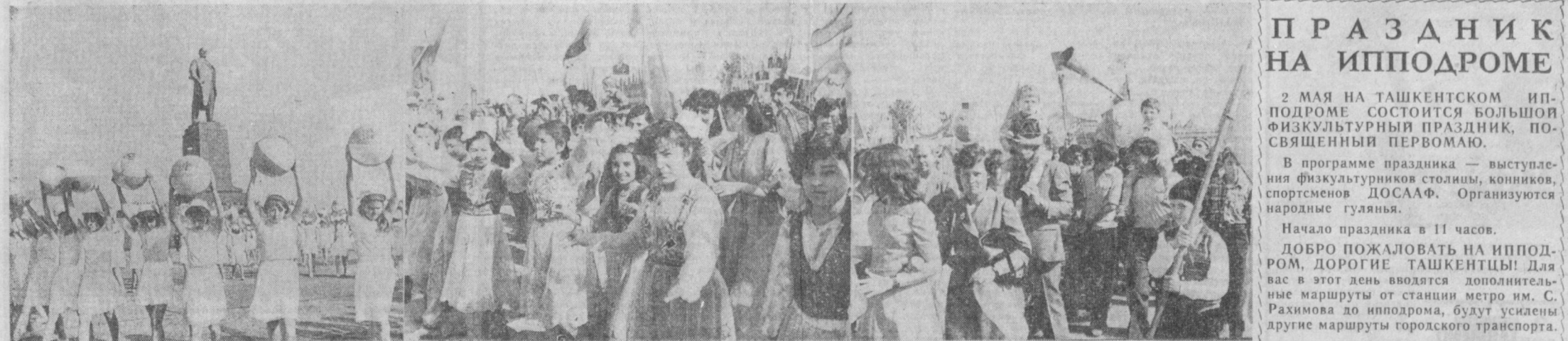
НА СНИМКЕ: в праздничных колоннах демонстрантов.

Праздник шагает по площади, разливается по улицам Ташкента. Песней звучат над городом слова: «Мир», «Труд», «Весна»... А. ТЮРИКОВ.