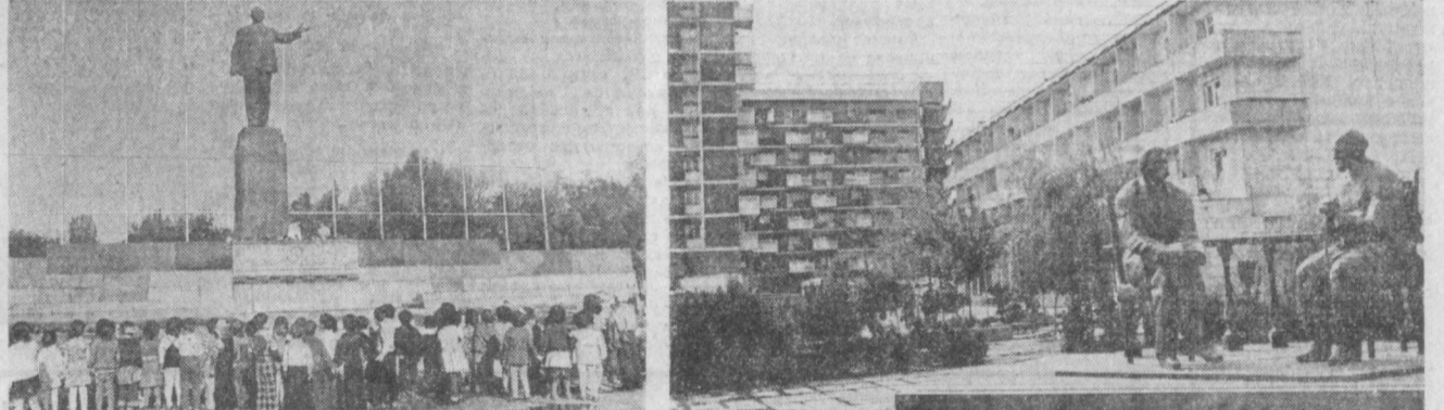
На встречу Дням литературы и искусства Таджикистана в Узбекской ССР