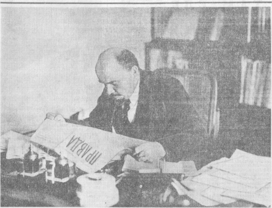
В. И. Ленин в своем кабинете в Кремле. Москва, 1918 год.

Ташкентское производственное объединение по металлообработке начало изготавливать складные стульчики для малышей. Их конструкция проста и