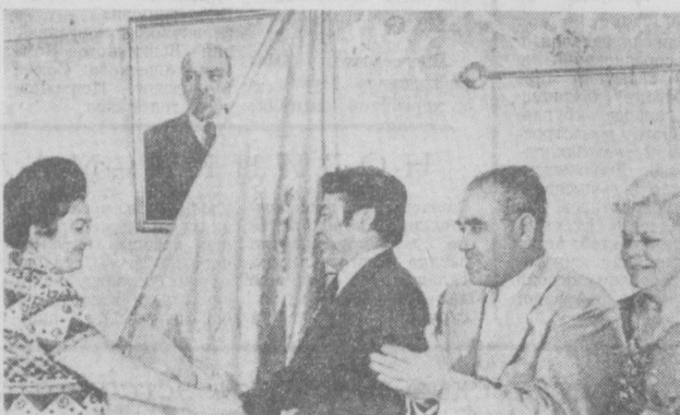
Можно не сомневаться, что труженники треста возьмут наградные рубли. Для этого здесь имеются все предпосылки. А. ХАТАМОВ. НА СНИМКЕ: момент вручения переходящего Красного знамени ЦК КП Узбекистана и Совета Министров Узбекской ССР.

таженности, третий автоматически проявляет и сжигает фотоконтейнеры газетных полос. Передающие аппараты комплекса установлены в аппаратном зале пункта передачи газет в Москве. Каждый из них может обеспечивать бесперебойную передачу изображения газетной полосы на шесть приемных аппаратов, которые установлены в специально оборудованных помещениях при типографии и пунктах приема газет. Менее чем за три ми-