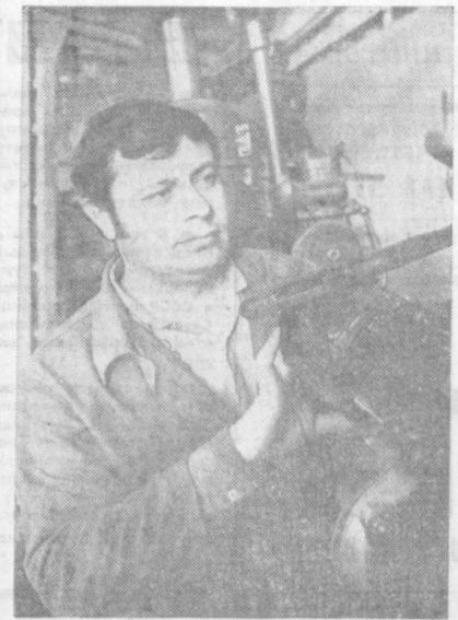
В коллективе опытного ремонтно-механического завода «Госкомсельхозтехника» широко разворачивается социалистическое соревнование за досрочное выполнение заданий первого года одиннадцатой пятилетки. В авангарде трудового соперничества идут коммунисты, кадровые рабочие предприятия, комсомольцы.

В настоящее время во всех коллективах проводится анализ достигнутого, выявляются резервы и возможности для усиления помощи сельским хозяйствам. Предусматриваются работы по строительству животноводческих комплексов, полевых станций, отправка в сельские хозяйства «автолукучек» и другой техники, выделение частей и материалов и многое другое.