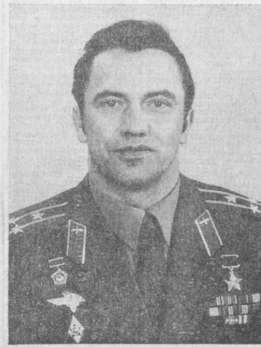
Командир космического корабля «Союз-40» летчик-космонавт СССР, Герой Советского Союза Леонид Иванович ПОПОВ.

импульсный маневр дальнего блуждания «Союза-40» с орбитальным комплексом «Салют-6» — «Союз Т-4». Параметры траектории корабля «Союз-40» после коррекции составляют: — максимальное удаление от поверхности Земли — 307 километров; — минимальное удаление от поверхности Земли — 260 километров; — период обращения — 90,1 минуты; — наклонение — 51,6 градуса. Космонавты Владимир Коваленок и Виктор Савиных на борту научно-исследовательского комплекса «Салют-6» — «Союз Т-4» готовятся к стыковке. Они провели уборку помещений станции, подготовили аппаратуру к телевизионному репортажу о встрече экипажа экспедиции посещения. Полет обоих космических аппаратов проходит в соответствии с запланированной программой. Космонавты Коваленок, Савиных, Попов и Прунариу чувствуют себя хорошо.