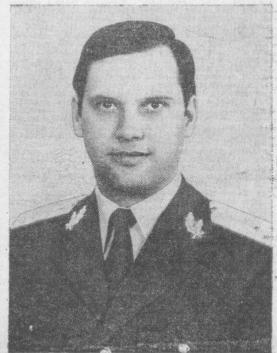
Космонавт-исследователь космического корабля «Союз-40» гражданин Социалистической Республики Румынии Думитру ПРУНАРИУ.