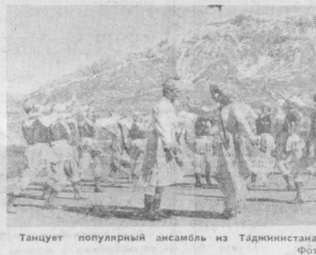
Танцует популярный ансамбль из Таджикистана «Лола».