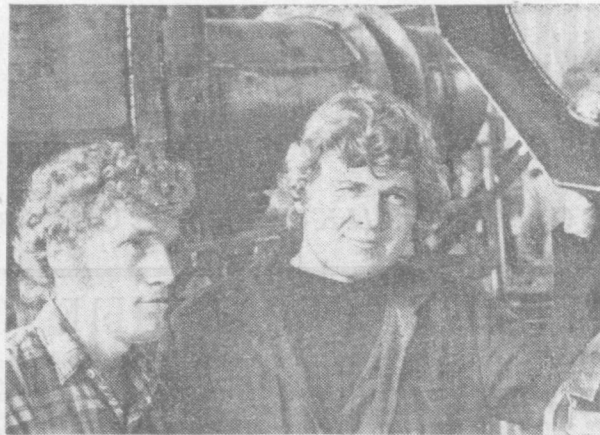
Ударно трудятся в первом году одиннадцатой пятилетки члены комсомольско-молодежной бригады цеха капитального ремонта завода «Геологоразведка».

На заводе ЖБИ-2, санитарно-технического в графе отставших оказался ряд цехов и бригад. И здесь трудовая дисциплина не на высоте. На заводе санитарно-технического велика текучесть кадров. На предприятии слабо выполняются технико-экономические показатели. Интересы дела требуют широко подвигать инициативу москвичей, полнее использовать резервы, достижения науки и техники с целью повышения эффективности производства.