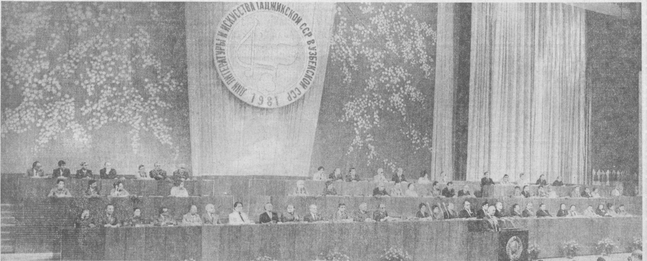
Ташкент, 19 мая. Дворец дружбы народов СССР имени В. И. Ленина. Президиум торжественного вечера, посвященного открытию дней литературы и искусства Таджикской ССР в Узбекской ССР.