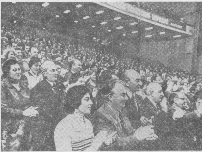
Торжественное заседание в Тбилиси. На трибуне — товарищ Л. И. Брежнев.

Речь товарища Л. И. Брежнева была выслушана с огромным вниманием и неоднократно прерывалась бурными, продолжительными аплодисментами.