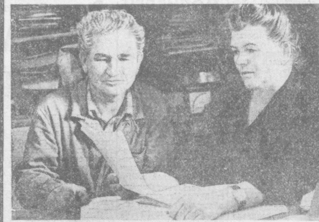
Все большим спросом у ташкентцев пользуется продукция зерно-мелебной фабрики. Ее отличают красивый внешний вид, добротность. Строго следят за качеством изделий народные контролеры.