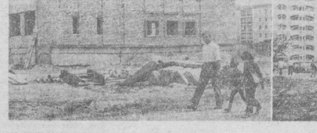
Немало времени и средней школы № 208 Куйбышевского района, чтобы собрать этот мешок затратили учащиеся Куйбышевского района, галлический дом. И вот

Продвигая магазин № 2 Чиланзарского районного комитета народного контроля, магазин «Астроном» № 16 Ганева, можно было и не привлекать к ответственности за обман на две копейки на каждой бутылке. Если бы такой обман был случайным! Но дело в том, что они постоянно принимают бутылки