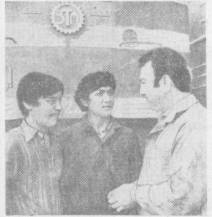
В Ташкентском тепловом депо ведется большая наставническая работа. Кадровые производственные шедры делают опытом, знаниями с молодежью.

№ 126 (4524) ПЯТНИЦА 5 июня 1981 г. Издается с 1 июля 1966 г. Цена 2 коп.