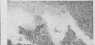
Необычайно богаты достопримечательностями туристские маршруты родного края. Это и горные пики со снежными вершинами, глубокие ущелья, стремительные горные реки, альпийские луга...

За лето в зоне отдыха побывает около тысячи сотрудников ТашЗНИИЭПа и членов их семей.