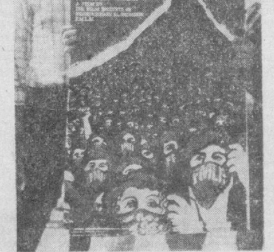
Волна демонстраций протеста против американского вмешательства в Сальвадоре прокатилась по Соединенным Штатам. Их участники осудили политику Белого Дома в Центральной Америке и потребовали немедленно прекратить военную помощь террористической хунте, в ирочи той борьбы народа Сальвадора за свободу и независимость.