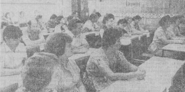
НА СНИМКЕ: во время встречи за «круглым столом».

«Очень важно добиться искренней доверия широких масс трудящихся, рабочих в первую очередь, и нашей пропагандистской работе. Для этого нужно, чтобы каждый человек был уверен, что он получит на свой вопрос искренний, обстоятельный, правдивый ответ. Необходимо отвечать на все вопросы, касаются ли это вопросов снабжения про-