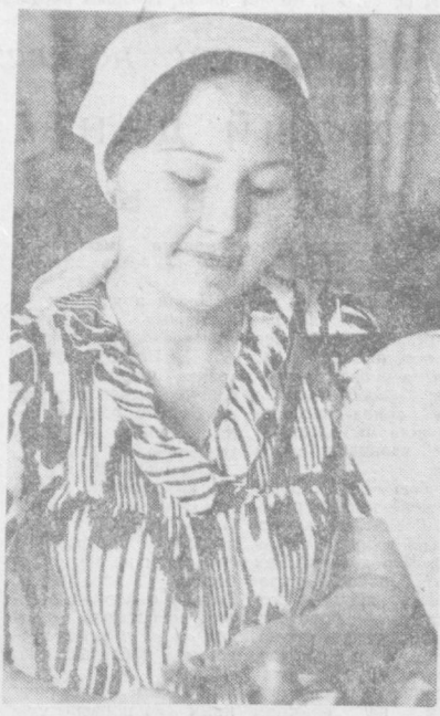
Большим спросом пользуются изделия, выпускаемые Ташкентским производственным объединением по металлообработке, — подковы, ведра, посуде.