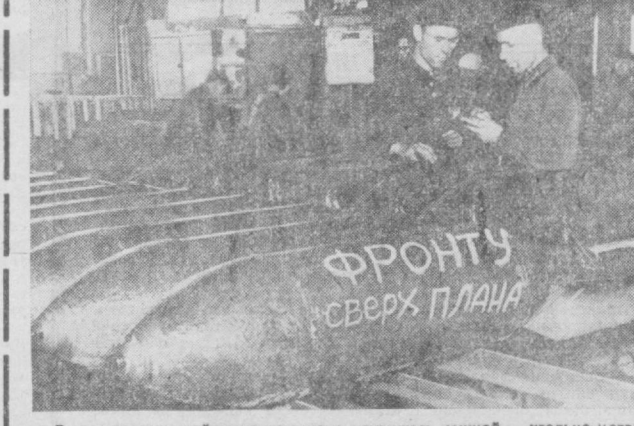
В первые годы войны, когда страна лишилась южной угольно-металлургической базы, Урал и Сибирь, Казахстан и Средняя Азия приняли на себя всю тяжесть снабжения Красной Армии. НА СНИМКЕ: Сибирь. 1942 год. Авиабомбы, выпущенные сверхплана, в цехе оборонного завода.