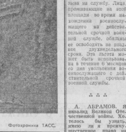
НА СПОРТИВНЫХ АРЕНАХ