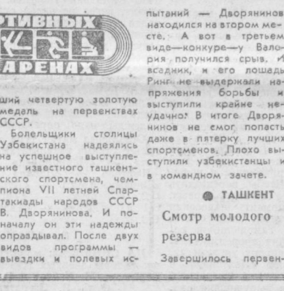
НА СПОРТИВНЫХ АРЕНАХ