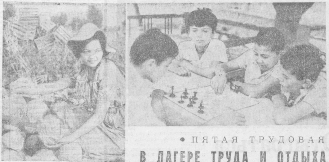
• ПЯТАЯ ТРУДОВАЯ В ЛАГЕРЕ ТРУДА И ОТДЫХА

перевозки хлопка. Помню потемневшие деревянные перекрытия цехов... К хлопководу сезон завод прихорашивался, однако не мог скрыть своего возраста. Потом я узнал, даже прочитав в одной брошюре, что Ташкентский хлопковод переведен в кишлак Карасу. Поселок Карасу находится недалеко от узбекской столицы, на берегу одноименной реки. Завод окружен хлопковыми полями. Кусты подступают к забору, к асфальтированной дороге, словно стремятся перешагнуть это единственное препятствие. Прошлым летом я побывал там. — У нас своя биография, — сказал главный инженер на расуевского завода. —