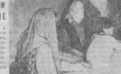
посвящен 60-летию КПН — боевого авангарда трудового народа. В программе праздника — выставки и кинофильмы, выступления самодельных коллективов и профессиональных артистов. Проведение праздников КПН стало традицией. Они являются важной формой работы коммунистов.

Веселые истории о Ходже Насретдине, его приключениях с богатыми, полные озорной народной мудрости, станут основой многосерийного мультипликационного фильма, названного именем этого героя.