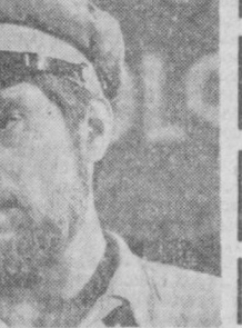
НА СНИМКАХ: кадры из фильма.