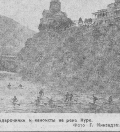
НА СПОРТИВНЫХ АРЕНАХ