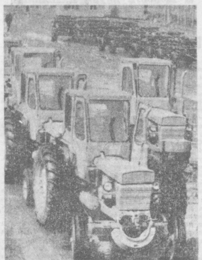
На СНИМКАХ: ударник коммунистического труда Л. Дубинина; продукция тракторного завода, готовая к отправке.