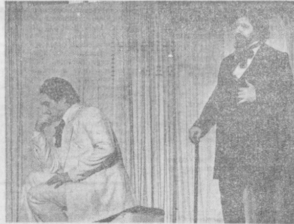
Своеобразным отчетом работы оперной студии Ташкентской государственной консерватории в завершающемся учебном году стала постановка оперы Джузеппе Верди «Травиата».

«А что вы представляете на арене Ташкентского цирка? — Прежде всего хочется сказать о традиционном номере в вашем цирке — дрессуре слонов. Они у нас катаются на шарах и даже на велосипеде — естественно, «слоновья», весом более 50 килограммов, проделывают множество других трюков, которым научил их дрессировщик Герхард Квайзер».