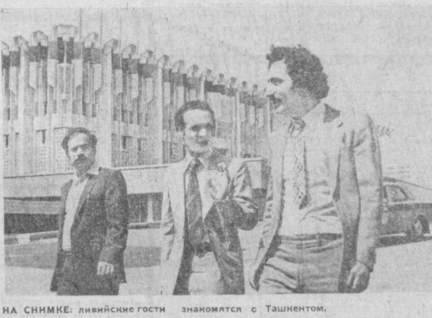
НА СНИМКЕ: ливийские гости знакомятся с Ташкентом.

По итогам всесоюзного смотра работы учреждений здравоохранения коллектив поликлиники № 1 Ленинского района удостоен переходящего Красного знамени Министерства здравоохранения СССР и Центрального комитета профсоюза медицинских работников.