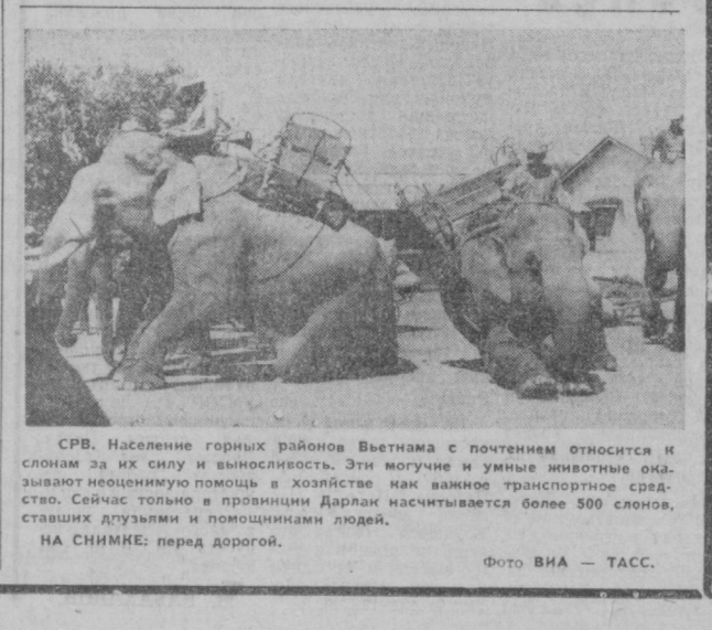
НА СНИМКЕ: перед дорогой.