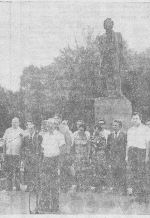
У памятника Пушкину.