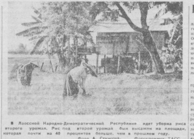
В Лаосской Народно-Демократической Республике идет уборка риса второго урожая. Рис под второй урожай был высечен на площади, которая почти на 40 процентов больше, чем в прошлом году.

Предполагается, что первые 11 километров туннеля калькуттского метро будут сложны в эксплуатации и 1985 году, отметил М. Данаева.