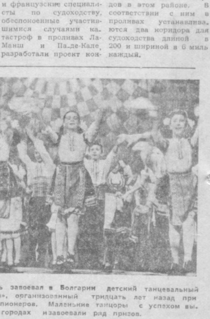
Широкую популярность завоевал в Болгарии детский танцевальный ансамбль «Росна Китна».