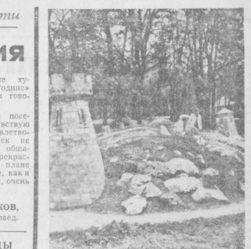
Черновицкая область. Около четырех тысяч специалистов подготовили за 32 года существования Старожицкий лесной техникум. Гордость техникума является дендропарк, где нашли себе новую родину более 1.000 различных растений из многих уголков земли. Дендропарк взят под охрану государства как уникальный памятник садово-парковой архитектуры.

На первые гастроли в Ташкент театр привез несколько спектаклей: «Голос недр», «Горь», «Неизвестный». Постановки были посвящены современности.