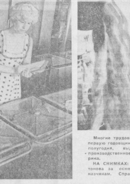
Многие трудовые коллективы города, стремясь достойно ознаменовать первую годовщину новой Конституции СССР, досрочно завершили план полугодия, выдали немало сверхплановой продукции. В их числе — производственное объединение «Средазэлектроаппарат» и кемафайн фабрика.

Особо хотелось бы отметить отношение к строительству со стороны заказчика. Руководство бумажной фабрики постоянно интересуется нуждами строителей, оказывает содействие во всем. Многие труженники фабрики и выходящие дни добровольно работают на стройплощадке. И, конечно же, подобное сотрудничество, горячая заинтересованность обеих сторон в успехе дела дают свои плоды. В мае на строительстве этого детского сада освоено 100 тысяч рублей — столько, сколько планировалось. В настоящее время осталось выполнить различных работ менее чем на 15 тысяч рублей. И строители уверены, что в июле малыши смогут поселиться в своем новом доме. С уверенностью можно сказать, что в июле малыши смогут поселиться в своем новом доме.