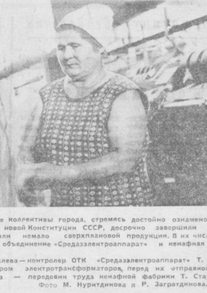
Многие трудовые коллективы города, стремясь достойно ознаменовать первую годовщину новой Конституции СССР, досрочно завершили план полугодия, выдали немало сверхплановой продукции. В их числе — производственное объединение «Средазэлектроаппарат» и кемафайн фабрика.

Орлон, звезды RX Волопаса и некоторых других звезд. Фобос — спутник Марса, по мнению исследователей, является как раз недостающим звеном, необходимым для процесса образования планетной системы, который, возможно, происходит в космосе. Аминокислоты, как известно, являются основным «строительным материалом» для образования белков — основы всех живых организмов. Хотя в настоящее время метан — не самый распространенный газ в земной атмосфере, считают, что он был основным компонентом атмосферы нашей планеты в период ее образования — более четырех миллиардов лет назад.