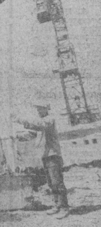
▲ ПРЕСТИЖ ПРОФЕССИИ