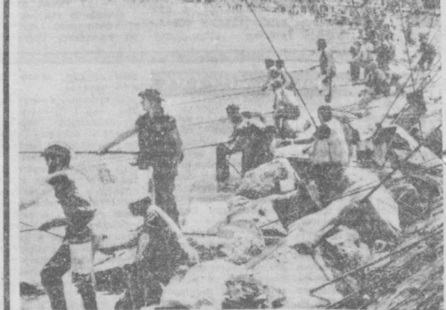
ШВЕДЦАРИЯ. Около 400 рыбаков приняло участие в международных соревнованиях по спортивной рыбной ловле на берегу озера Лугано.

Поэтому в 1975 году в Кукейре был создан заповедник, где разводятся крокодилы. Сейчас здесь обитает 1,100 особей. Когда животное достигает двухметровой длины, его выпускают на волю. Недавно очередная партия в 250 крокодилов переселилась в долины реки в национальный парк им. Дж. Корбетта.