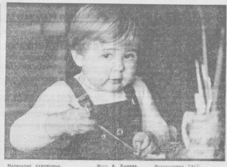
Маленькая художница.