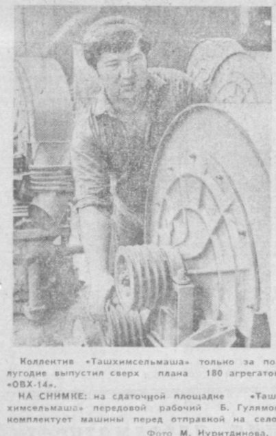
Коллектив «Ташсельмаша» только за полугода выпустил сверх плана 180 агрегатов «ОВХ-1А».

Следом за славным традициям союзов Серпа и Молота, машинистами завода постоянно оказывают эффективную помощь земледельцам, осуществляют ремонт сельскохозяйственной техники, помогая оборудо-