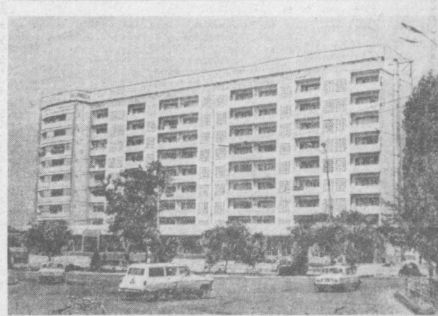
ТАШКЕНТ СЕГОДНЯ. Новый жилой дом на Луначарском шоссе. На первом этаже здесь расположен узел связи — почта, телеграф.

ЖИЗНЬ ВУЗОВ ПО ПРОГРАММЕ «АБИТУРИЕНТ-78»