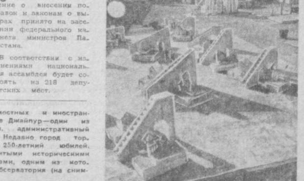
Ежегодно сотни тысяч местных и иностранных туристов приезжают в Джайлур — один из древних городов Индии, административный центр штата Раджастан. Недавно город торжественно отметил свой 250-летний юбилей. Джайлур известен знаменитыми историческими архитектурными памятниками, одним из которых является старинная обсерватория (на снимке).