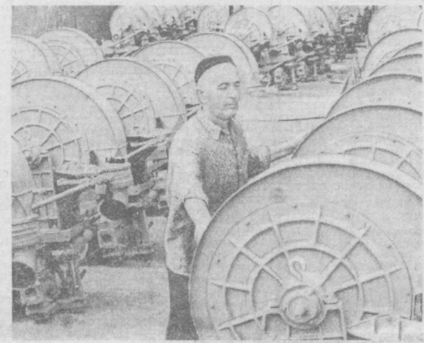
Завод «Ташхимсельмаш». Здесь изготавливаются агрегаты для химической борьбы с сельхозвредителями. За последние годы эти машины — «ОВХ.14» — стали широко использоваться для проведения наземной обработки хлопчатника. Это способ снятия листьев с растений более эффективен и экономичен. НА СНИМКЕ: машины «ОВХ.14» перед отправкой в хлопководческие районы.

Б. АКСАНИЧ, старший инженер НПО «Техноло».