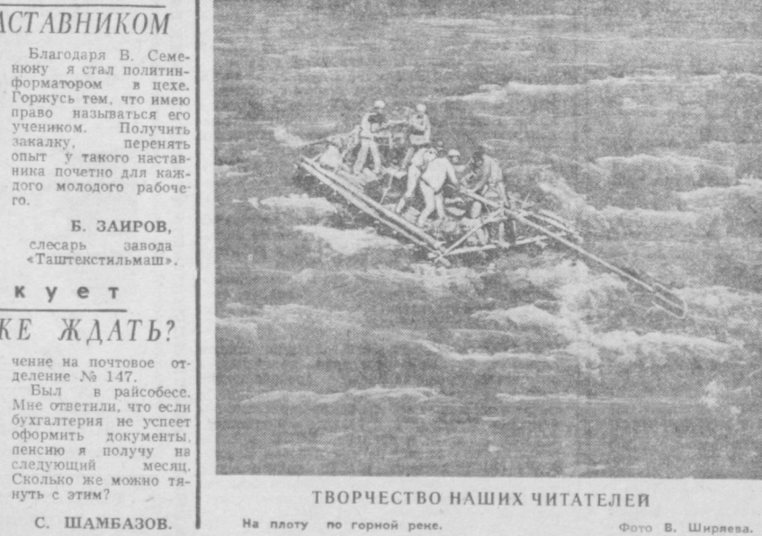
На плоту по горной реке.