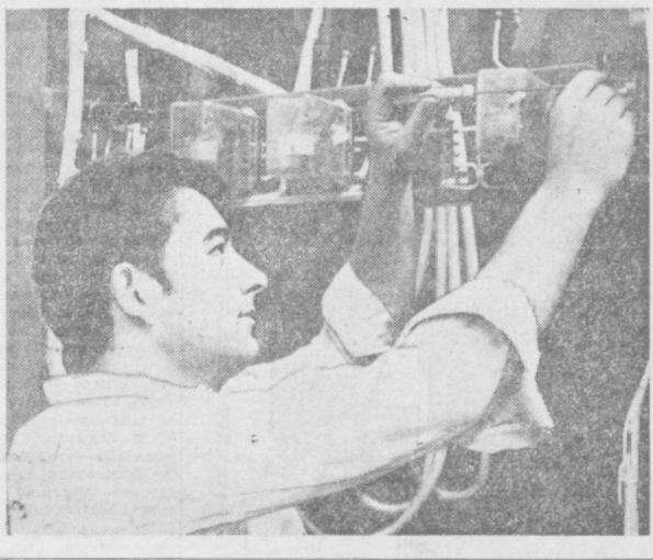
НИКТО НЕ ЗАБЫТ, НИЧТО НЕ ЗАБЫТО