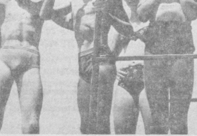
Юные прыгуны в воду.

Мелнораторы, работающие в верхних реках Шустки в Сумской области, были удивлены, обнаружив утром, что прорытый ими накануне водоотводный канал перерожен плотной из веток, травы и глины. Неоднократные попытки расчистить его успеха не имели: каждое утро появлялась еще более прочная плотина. Таниственцы и «строителями» оказались бобры. Дело в том, что проводимые здесь мелнораторские работы вызвали значи-