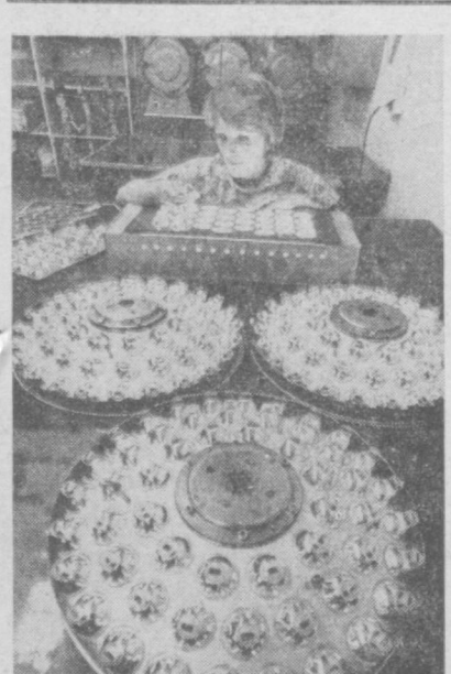
Ловечский завод — од-

За время сезона в транспортных органи- зациях пройдет ком- плексная проверка автомобильного парка, сотрудники ГАИ вы- ступят перед водите- лями с лекциями, бесе- дами по безопасно- сти дорожного движе- ния. Большая работа будет проведена и с жителями столицы по лучению дорожных правил.