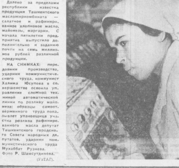
Далеко за пределами республики известна продукция ташкентского машиностроения — салатное и рафинированное хлопковое масло, майонез, маргарин. С начала пятилетия предприятие выпустило дополнительно к заданию почти на семь миллионов рублей разную продукцию.

Светлана ВИНУКОВА, научный комментатор АПИ.