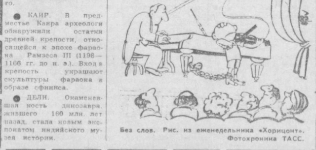
Без слов. Рис. из альманаха «Горизонт».

● ДЕЛИ. Окаменевшая кость динозавра, жившего 160 млн. лет назад, стала новым экспонатом индийского музея истории.