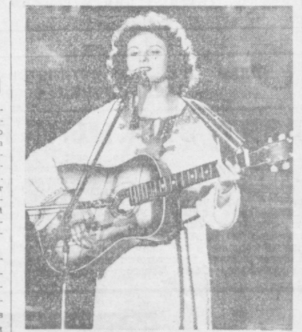
Польская певица Ева Пшиходзин, получившая первую премию на XIV фестивале советской песни в городе Зелена-Гура.

Каждый год на развитие химической промышленности в народной Болгарии расходуется около 400 миллионов левов. На нынешнем этапе эти средства выделяются для развития нефтехимии.