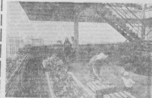
Этот небольшой сад дома, во дворе в Минске, на улице, могут здесь открыть 18.3-этажное «Восток-1» благодаря содружеству архитекторов и ученых Ботанического сада АН БССР, жители Фото В. Меньяч, Фотохроника ТАСС.