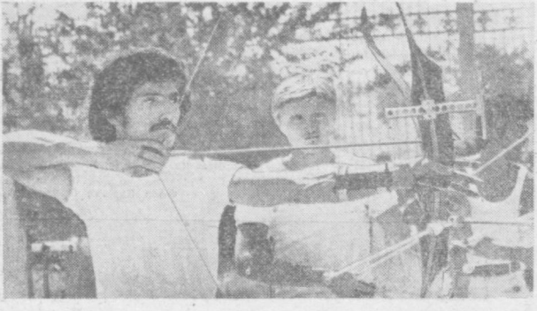
ВИЗИТНАЯ КАРТОЧКА СОПЕРНИКА