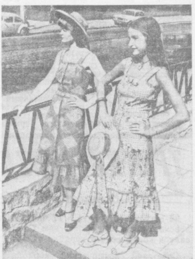
ПОЛЬША. НА СНИМКЕ: эти девушки носят летние сарафаны, шитые из хлопчатобумажных тканей, которые выпускает Щецинская фабрика «Дана».