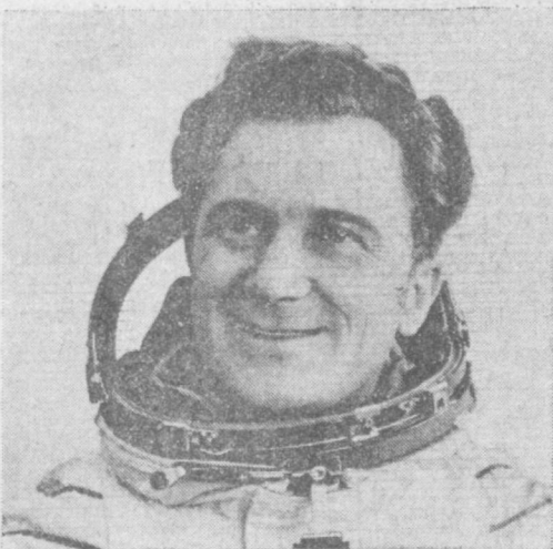
ИЕН Зигмунд, космонавт-исследователь корабля «Союз-31» подполковник