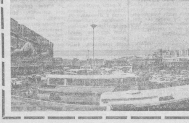
М. РАХИМОВ, корр. УзТАГ, Анджиан.

Филиппины — государство в Юго-Восточной Азии, расположенное на 7.100 островах, из которых обитаемых всего 800. Страна древней культуры и сложной исторической судьбы. Филиппины в течение нескольких столетий страдали под гнетом иноземных поработителей. Тридцать один год назад Филиппины провозгласили независимость, однако до сих пор республика остается под незримым контролем западных монополий, являясь источником дешевого сырья и дешевой рабочей силы. На снимке: Манила, центр города.