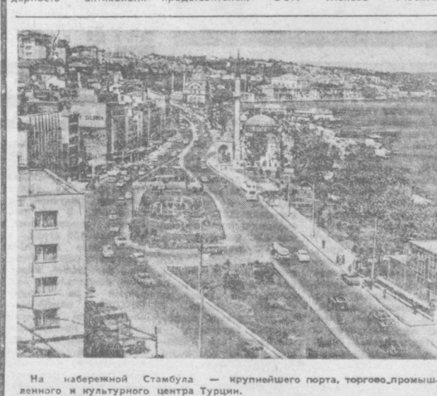
На набережной Стамбула — крупнейшего порта, торгового, промышленного и культурного центра Турции.

Опыт учит, что своевременно составленные мероприятия сами по себе еще не обеспечивают подготовку производства к работе в осенне-зимних условиях. Нужно уже сегодня начинать заготавливать энергетические ресурсы, приступать к ремонтным работам. Следует навести твердый порядок, при котором не было бы места беспорядочности, насправной трате средств и материалов.