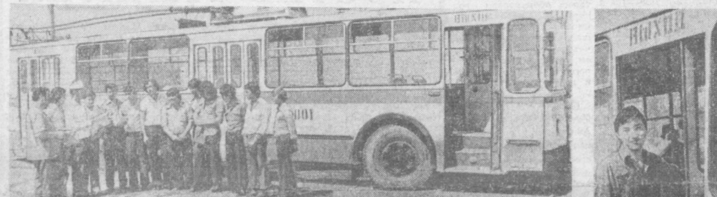
ФОТО РЕПОРТАЖ В ПЕРВЫЙ РЕЙС

треста № 153 Главташкентстрой с двухнедельным опережением графика завершил общестроительные работы на четырехэтажном общежитии для учащихся музыкального училища в Чиланзарском районе. Ускоренными темпами ведутся отделочные работы. Штукатурят, мажут СУ-20 треста «Отделстрой» первыми нормативными нормами на 25—30 процентов. Как обещали строители, новоселье в новом общежитии учащихся справят в начале сентября.