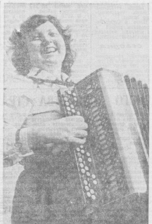
О БАЯНИСТКА. (Студентка музыкального училища имени Хамзы Ойла Пуськова).