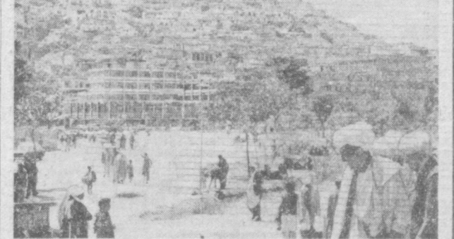
Правительство Демократической Республики Афганистан уделяет особое внимание принятию практических шагов для осуществления революционной программы, начата разработка пятилетнего плана социального и экономического развития страны, принят ряд проектов регионального значения, а также намечены конкретные мероприятия, направленные на развитие в области культуры и образования. НА СНИМКЕ: в одном из парков Кабула, столицы Афганистана.

У. ТИМОШЕНКО, старший инженер-синоптик САРИНГИНИ.