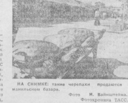
НА СНИМКЕ: танке черепахи проданы на манном базаре.

ни на пленку в других странах. Так, сейчас два канала шведского телевидения, являющиеся здесь относительно самостоятельными организациями, соревнуются за право показа шоу с участием «АВВА», заснятого в США. Осенью «АВВА» снимает телешоу по аналогу японского телевидения, а затем, как ожидается, вновь выступит с собственной программой по американскому телевидению. С. ВОЛОДИН. Стокгольм.