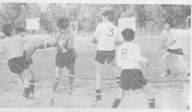
XV ВСЕСОЮЗНАЯ СПАРТАКИАДА ШКОЛЬНИКОВ

Отличительная особенность спартакиады нынешнего года в том, что на ее старты вышли буквально стар и мал. В зачет спартакиады вошли результаты спартакиад ЖЭК и домоуправлений. В соревнованиях принимали участие школьники и пенсионеры, сдающие подматны всеобщего физкультурного комплекса «Готов к труду и обороне СССР». Наиболее массовый размах получили состязания школьников. На стартах вышли буквально все учащиеся средних школ столицы республики.