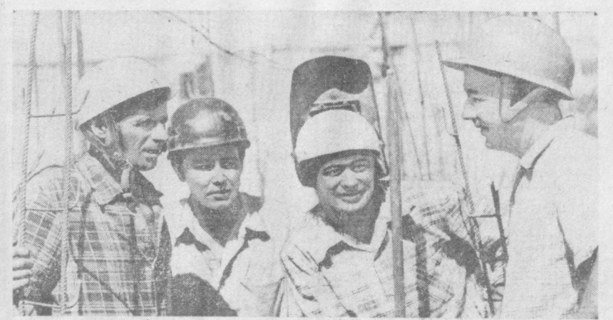
ЭЛЕВАТОР ДЛЯ КОМБИНАТА НА ВАХТЕ СТРОИТЕЛИ