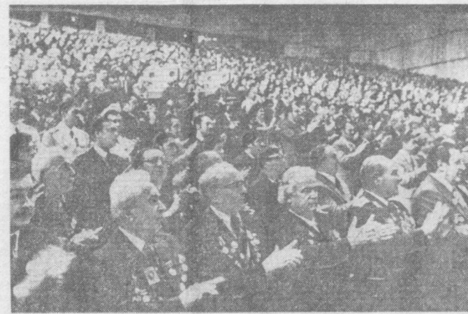
На снимках: во время торжественного заседания. На трибуне Л. И. Брежнев.

В зале собрались члены и кандидаты в члены ЦК Компартии Азербайджана, депутаты Верховных Советов СССР и Азербайджанской ССР, знатные производственники, передовики сельскохозяйственного производства республики, деятели науки и культуры, ветераны ленинской партии, представители общественных организаций.