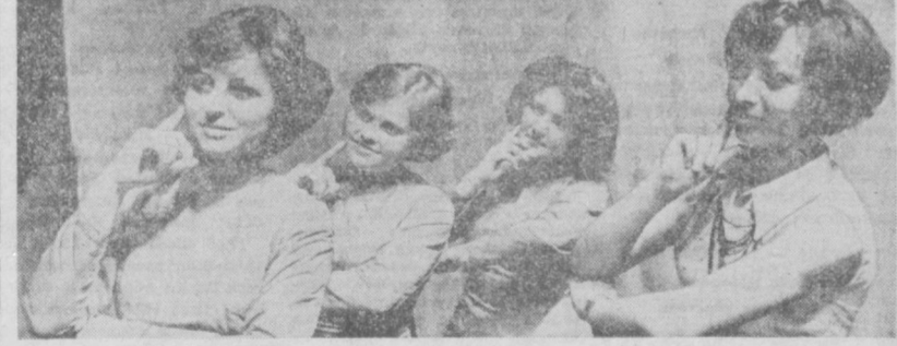
Большой популярностью у горожан пользуется танцевальный ансамбль Дома культуры имени А. Кадари. Самодельные артисты часто выступают в трудовых коллективах. НА СНИМКЕ: участники танцевального ансамбля исполняют сенту «Дружба народов».

Д. КУЗНЕЦОВ, корр. ТАСС, Брянская область.