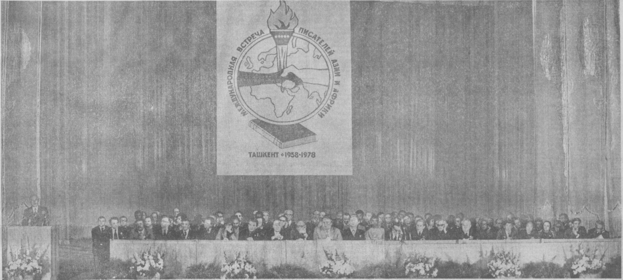
ТАШКЕНТ, 10 октября. Торжественное заседание в ознаменовании 20-летия первой конференции писателей стран Азии и Африки.